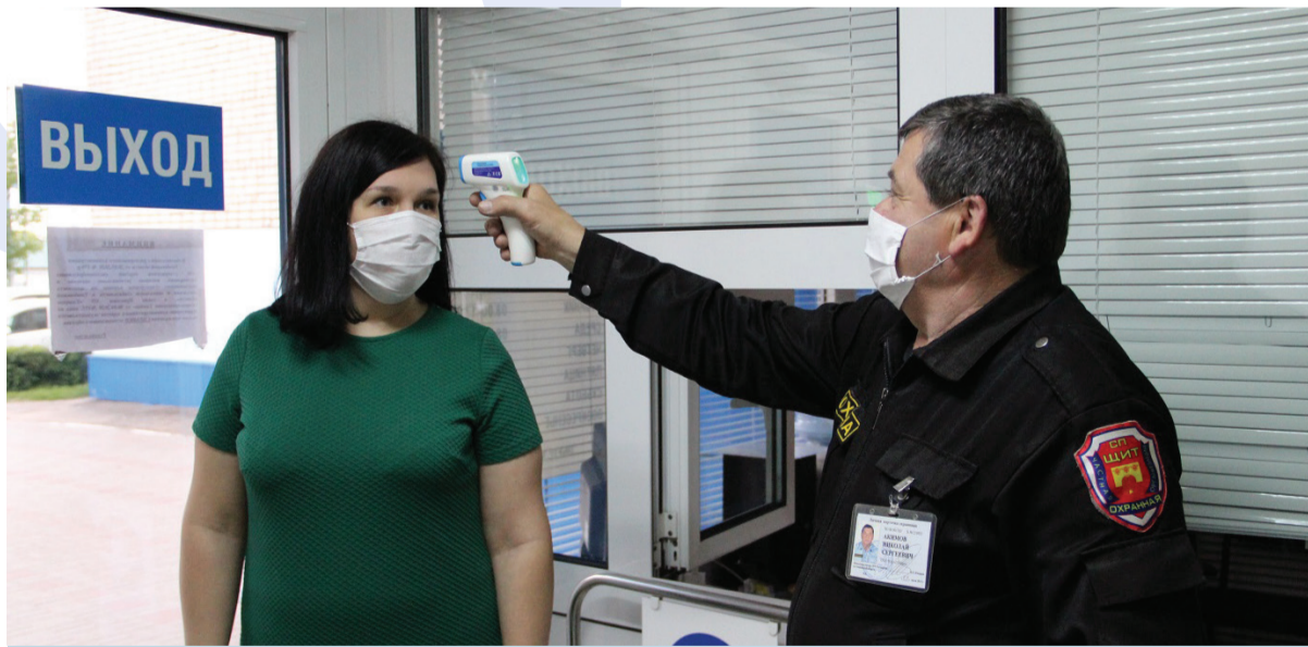
Обязательный утренний термометрический контроль

При содействии филиала ГБУЗ «Дезинфекционная станция» ТОКПД