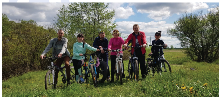
Там на неведомых дорожках... Коллектив котовских газовиков в велопоходе

– Неформальное общение объединяет. По сути наши совместные походы – это «Тимбилдинг» (англ. team – команда, building – строительство), командообразующие мероприятия, направленные на выработку единства внутри коллек-