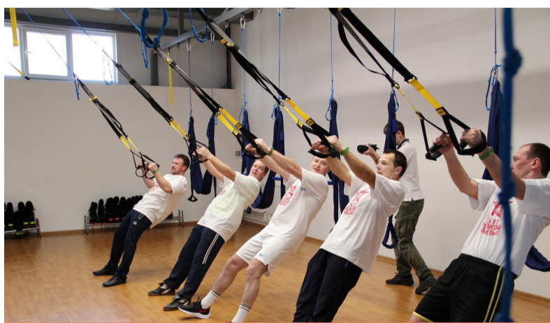
и закаляет характер!

В канун Дня защитника Отечества в АО «Газпром газораспределение Тамбов» прошли соревнования по кроссфиту, посвящённые 75-летию Великой Победы.