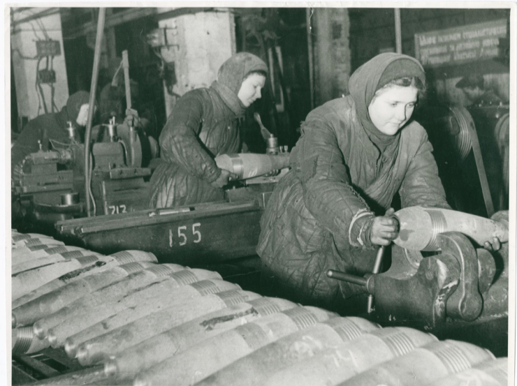
Всё для фронта! Всё для Победы!

Наша земляки, испытывая лишения и трудности, находили возможность вносить в фонд Красной Армии и обороны средства на боевую технику, собирали продовольственные посылки, тёплые вещи и другие подарки. Тамбовская область заняла первое место в СССР по реализации Государственного военного займа 1942 года и сбору средств наличными. ★