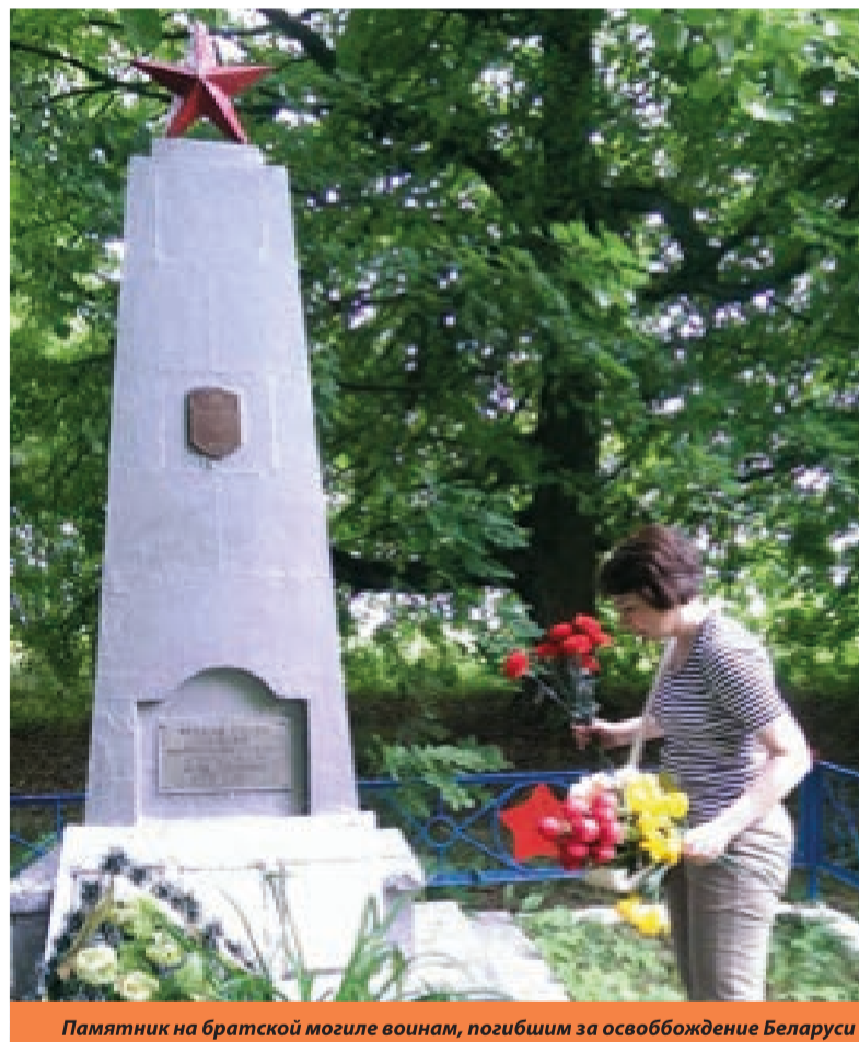
Памятник на братской могиле воинам, погибшим за освобождение Беларуси