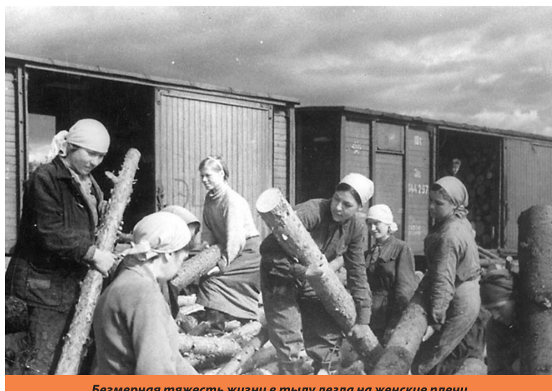
Безмерная тяжесть жизни в тылу легла на женские плечи

Они стремились сделать лучше, Тот мир, в котором мы живём. И благодарность в наших душах Горит негаснувшим огнём!