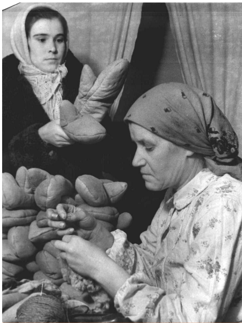
Фронт и тыл – едины!

Всё далее уходит в прошлое трагическое и героическое время Великой Отечественной войны. Всё менее остаётся людей, для которых война – не страница давней истории, а часть собственной жизни. И всё более настоятельной становится потребность понять характер и истоки событий 75-летней давности, оказавших столь решительное воздействие на судьбы десятков миллионов людей, событий, изменивших облик многих стран и народов.