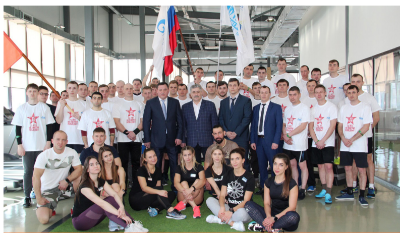
Спорт дарит позитив