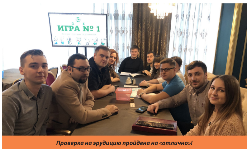
Проверка на эрудицию пройдена на «отлично»!

К оманда филиала АО «Газпром газораспределение Тамбов» в г. Тамбове стала серебряным призёром игры на эрудицию «Интеллектуальный градус». Организатором «Квиз, плиз!» выступила Тамбовская областная торгово-промышленная палата. Восемнадцать команд, представляющих крупнейшие предприятия и организации региона, сошлись в битве интеллектов.