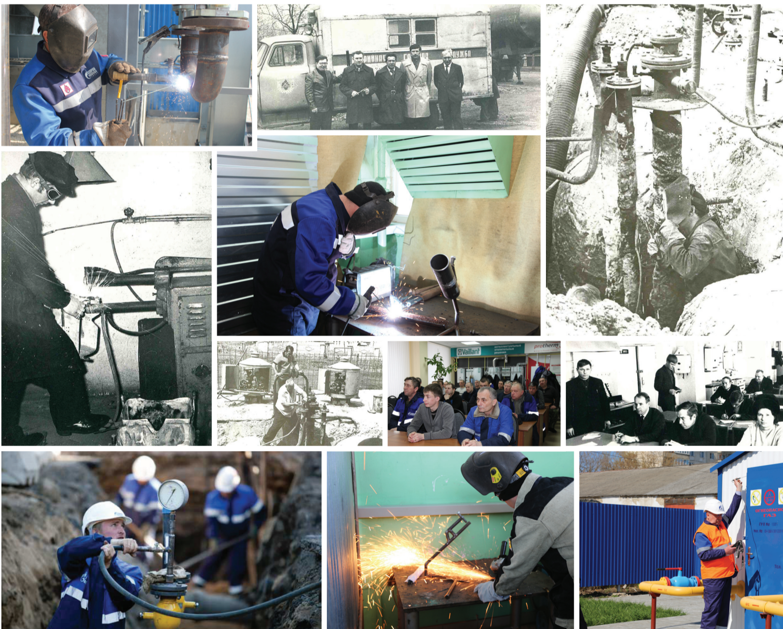
Ретро-снимки из архива АО «Газпром газораспределение Тамбов» (фото 60–70-х годов XX века)