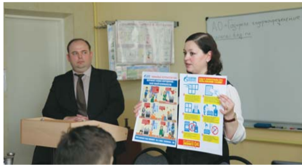
Проведение семинара в УМЦ

До конца учебного года специалисты АО «Газпром газораспределение Тамбов» проведут в школах Тамбова и Тамбовской области более 50 уроков и «круглых столов» на тему: «Газ: азбука безопасности». В летний период специалисты продолжат работу по пропаганде газовой безопасности в детских оздоровительных и молодёжных спортивных лагерях.