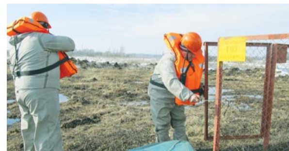
Отработка действий аварийно-спасательного формирования в зоне предполагаемого затопления