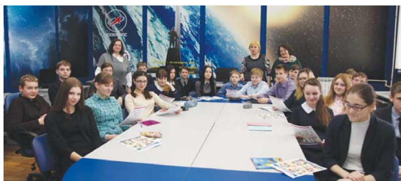
Проведение урока в школе № 22 г. Тамбова

Проект, цель которого информирование школьников о правилах безопасного использования газа в быту, проводится в городских и сельских общеобразовательных учреждениях региона. В марте на базе учебно-методического центра общества и в школах специалисты провели 20 уроков. Тамбовские газовики познакомили около 400 школьников с правилами использования газа.