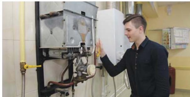
Урок в УМЦ. Знакомство школьников с газовым оборудованием