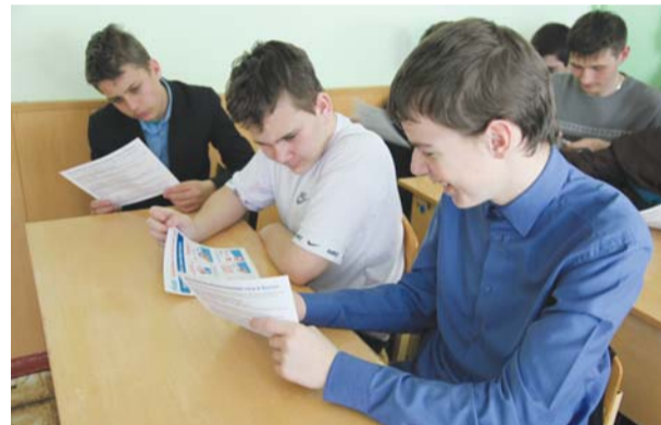
Урок в СОШ, с. Донское. Учащиеся знакомятся с памятками эксплуатации газового оборудования