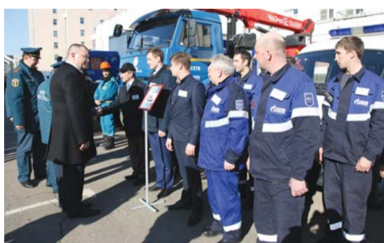
Участники смотра АО «Газпром газораспределение Тамбов»

В смотре участвовали более 40 единиц техники. Это наиболее востребованная техника во время сезонных рисков (паводок, пожароопасный сезон). Всего от территориальной подсистемы РСЧС к ликвидации паводка в готовности находится более 2600 человек и 625 единиц техники. Если во время пожароопасного периода разовьётся наихудший сценарий, на защиту Тамбовской области встанут более 11000 специалистов и 2730 единиц техники.