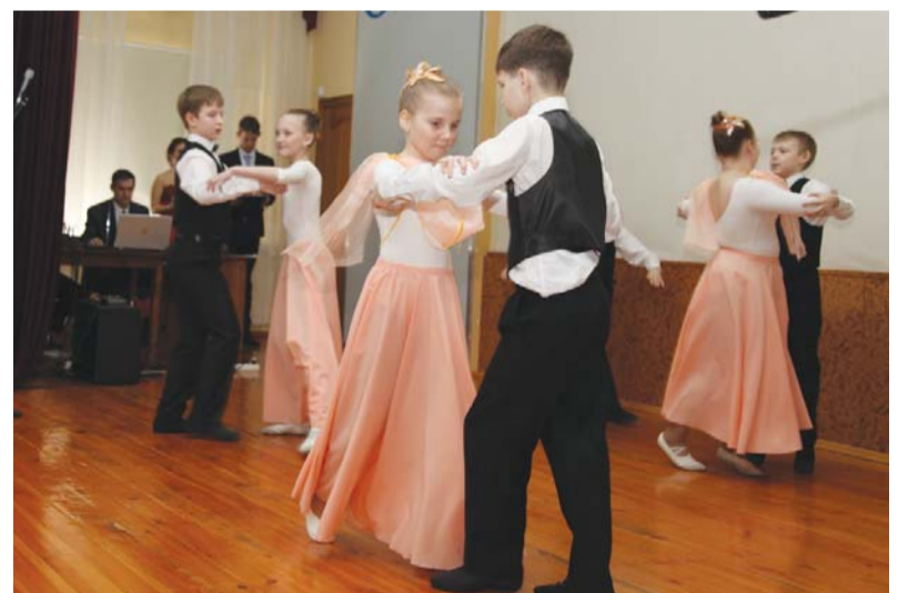
Выступает детская танцевальная студия АО «Газпром газораспределение Тамбов»