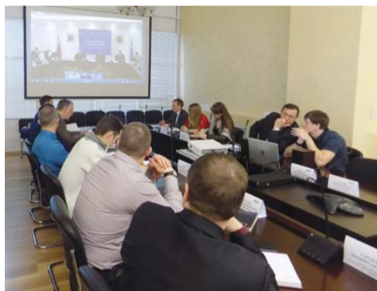
Работники АО «Газпром газораспределение Тамбов» приняли участие во Всероссийском селекторном совещании по усовершенствованию механизма технологического присоединения к газовой инфраструктуре