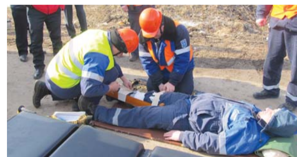
В ходе учений в филиале АО «Газпром газораспределение Тамбов» в п. Коммунар были продемонстрированы навыки оказания первой медицинской помощи