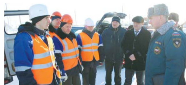
На смотре газовики филиала в г. Кирсанове представили аварийную бригаду и профессиональную аварийно-спасательную группу