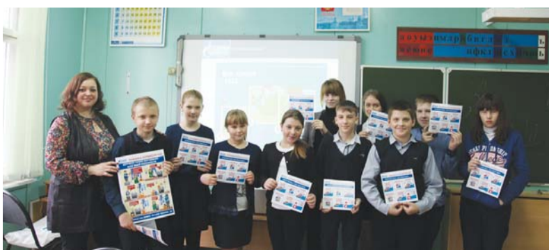
Учащиеся Красненской ООШ узнали правила использования газового оборудования