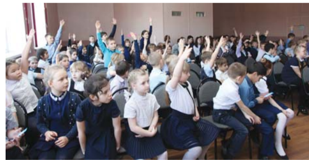
Учащиеся Инжавинской СОШ № 2 активно отвечали на вопросы викторины «Газ для нас»