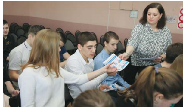
Раздача флаеров по правилам использования газа в быту в Инжавинской СОШ № 2