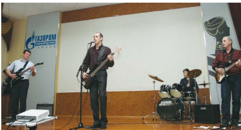
Выступление вокально-инструментального ансамбля