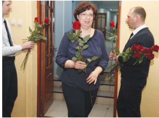
При входе в актовый зал мужчины дарили женщинам цветы