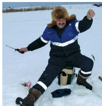
Ловись, рыбка, большая и маленькая