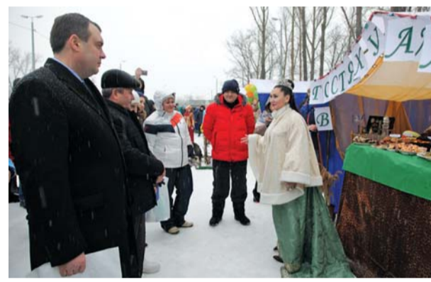
В гостях у Хозяйки Медной горы

Спартакиада позволила каждому почувствовать себя частью единой команды, которая работает ради общей цели. Участники соревнований в очередной раз доказали, что являются настоящими единомышленниками не только в работе, но и на спортивной арене. Спорт – сплачивает, объединяет и это – бесценно!