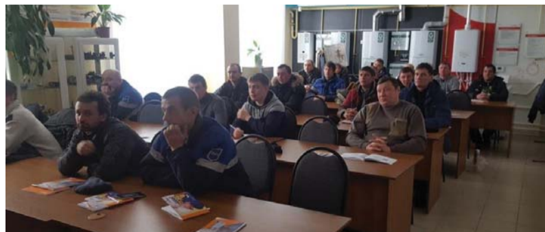
Занятия в учебно-методическом центре

В целях практической реализации положений нормативных документов по обеспечению единства измерений в обществе отделом метрологии был проведен семинар по теме «Законодательные основы обеспечения единства измерений. Практическая реализация положений нормативных документов по обеспечению единства измерений в АО «Газпром газораспределение Тамбов». На семинаре были рассмотрены новые нормативные документы в области метрологии, вопросы эксплуатации и типичные ошибки, возникающие при использовании средств измерений.