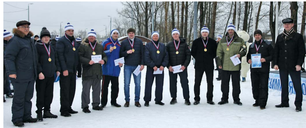
Лидер соревнований по футболу на снегу – сборная команда АО «Газпром газораспределение Тамбов» филиалов в г. Тамбове и в г. Кирсанове