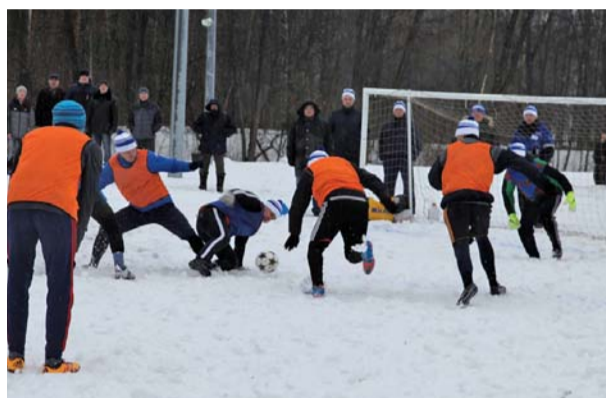
Футбольные баталии на снегу

22 февраля на лыжном стадионе в парке «Дружба» под общим девизом «Единство, сила, бодрость духа – наш вклад в успех родной страны!» прошёл зимний спортивный праздник среди работников ООО «Газпром межрегионгаз Тамбов» и АО «Газпром газораспределение Тамбов». Более пятисот участников и болельщиков из всех районов области приняли участие в празднике спорта.