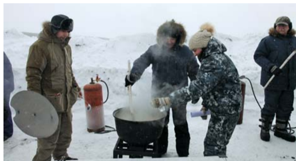
Последний этап приготовления ухи

4 февраля на Кершенском водохранилище прошли соревнования по подлёдному лову рыбы среди работников ООО «Газпром межрегионгаз Тамбов» и АО «Газпром газораспределение Тамбов».