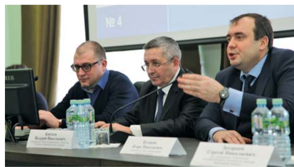
Заместитель главы администрации области Игорь Кулаков рассказывает школьникам о целях проекта