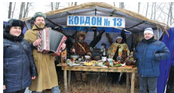
Хлебосольная палатка «Кордон № 13»