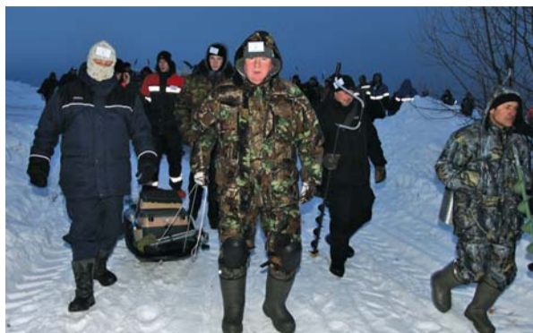
Участники соревнований направляются в сектора соревнований