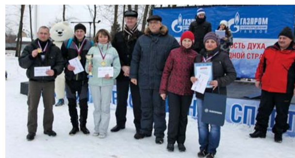
Команда филиалов АО «Газпром газораспределение Тамбов» в г. Рассказово и в г. Котовске показала лучший результат в беге в мешках