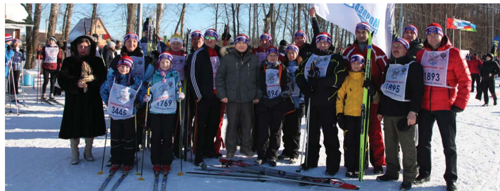
Сотрудники АО «Газпром газораспределение Тамбов» – участники и болельщики «Лыжни России – 2017»