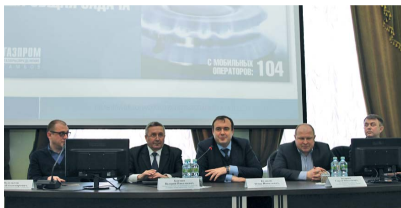
Презентация проекта «Газ для нас»