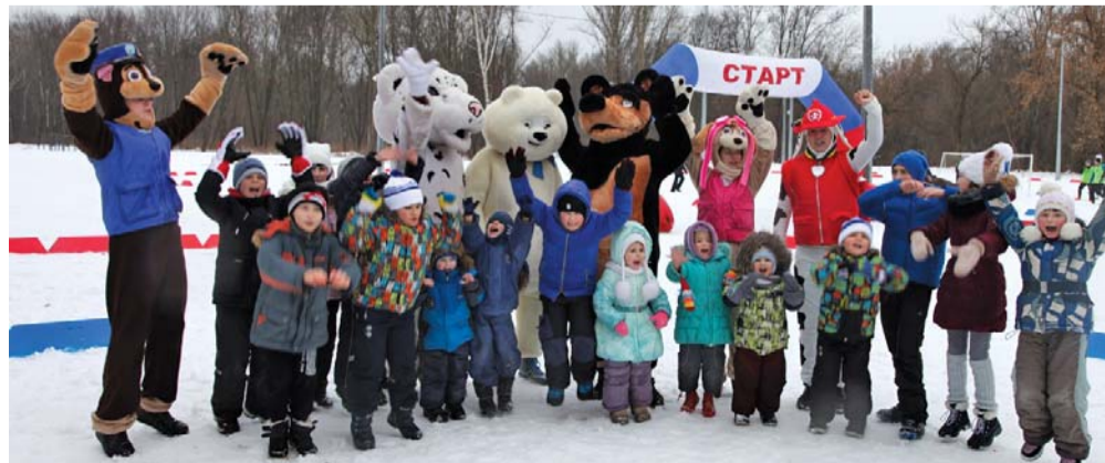
На детской игровой площадке было всем весело