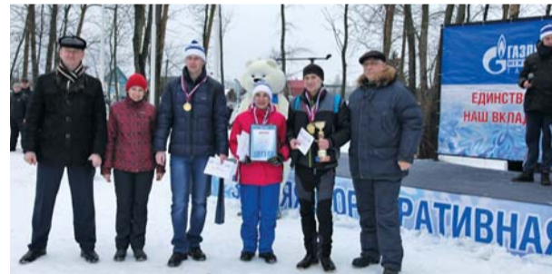
Победительница биатлонной эстафеты – команда филиалов АО «Газпром газораспределение Тамбов» в г. Рассказово и в г. Котовске