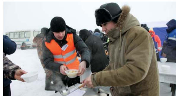
Уха получилась на славу