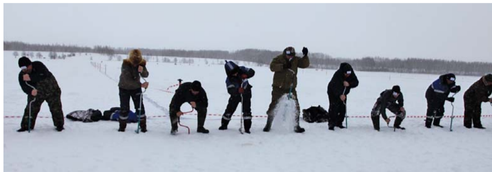
Проведение второго этапа конкурса – «Скоростной бурильщик»