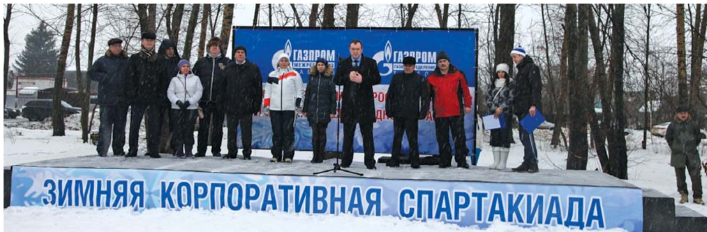
Торжественное открытие зимнего спортивного праздника