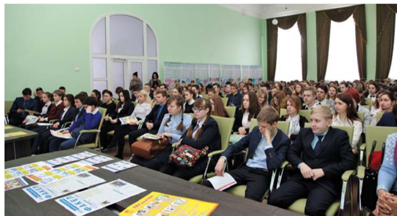
Участники проекта – учащиеся средних и старших классов школ города и области