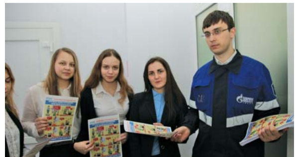
Раздача памяток по эксплуатации газовых приборов