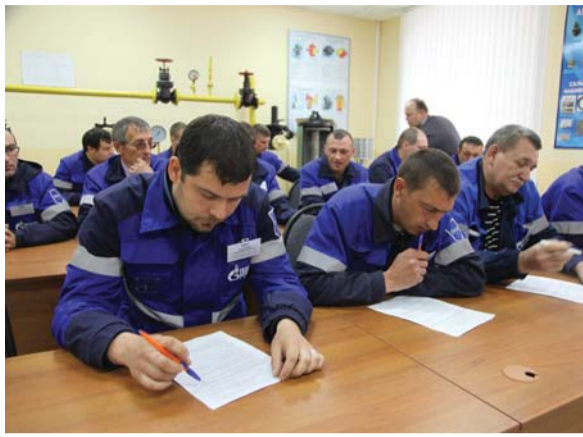
Проверка теоретических знаний по профессии

Результаты конкурса будут объявлены в торжественной обстановке на праздновании профессионального праздника — Дня работников нефтяной и газовой промышленности, а победитель смотра-конкурса, занявший первое место, будет получать ежемесячную надбавку в размере 30 процентов к должностному окладу за высокое профессиональное мастерство в течение года.