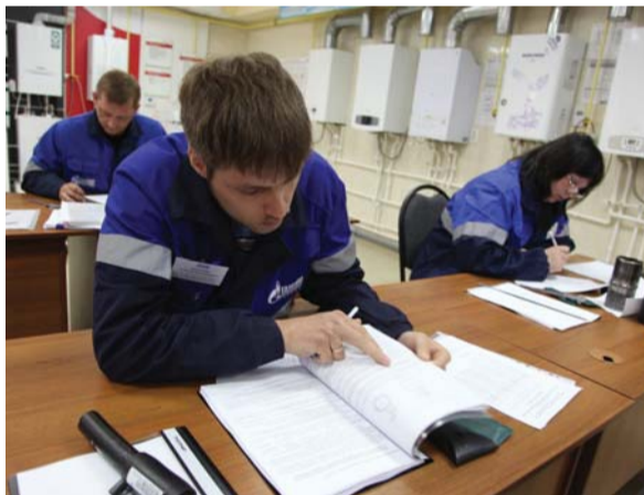
Проверка теоретического уровня подготовки конкурсантов

На втором этапе конкурса — определение теоретического уровня подготовки — конкурсанты отвечали на вопросы по методике проведения визуального и измерительного контроля.