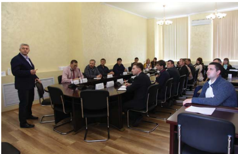
Обучение сотрудников общества работе СУ НТД «Эксперт»

Техническим блоком ООО «Газпром межрегионгаз» в целях повышения эффективности работы с нормативной базой в области проектирования, строительства и эксплуатации сетей газораспределения создается база данных внутренних нормативно-технических документов на базе системы управления НТД «Техэксперт». В настоящее время в обществе проводится тестовая эксплуатация СУ НТД «Техэксперт».