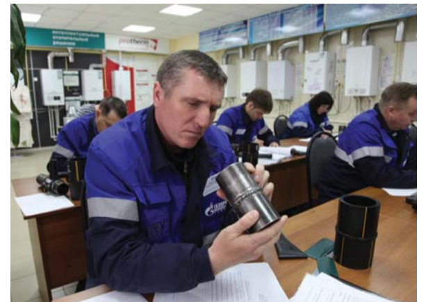
Выполнение практического задания специалистами по визуальному и измерительному методу контроля