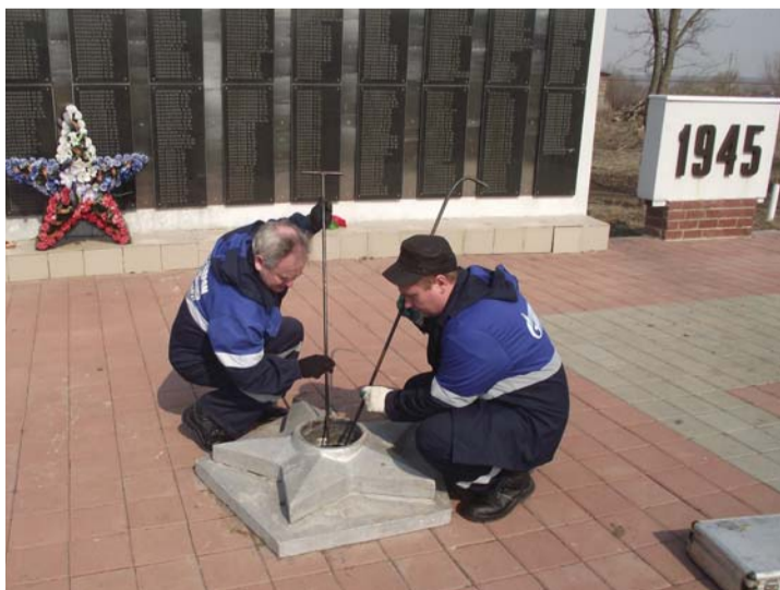
Работники филиала АО «Газпром газораспределение Тамбов» в г. Тамбове проводят техническое обслуживание мемориала огня Вечной славы

Кроме того, 9 мая специалисты аварийно-диспетчерских служб газораспределительной организации в целях безопасности дежурили у мемориалом «Вечный огонь».