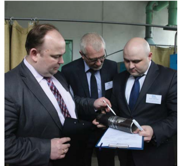
Конкурсная комиссия проводит визуальный осмотр сварочного стыка