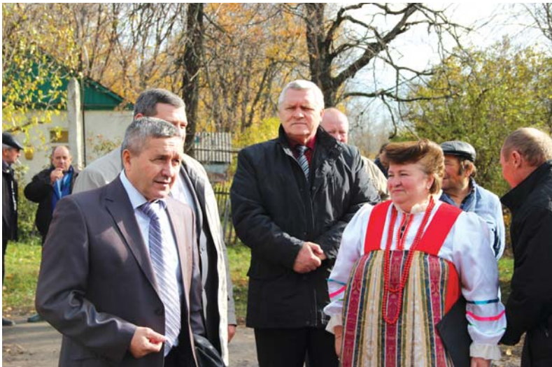
Пуск газа – всегда праздник для селян

Кто-то из селян оживлённо обсуждал, как планируют распорядиться высвободившимся временем – с приходом газа трудоёмкая колка дров и растопка печи остаётся в прошлом, кто-то потирал руки в предвкушении блинов и молодой картошки – приготовленных уже на новой – газовой плите. Одним словом, с приходом «голубого топлива» жизнь села обрела новое дыхание.