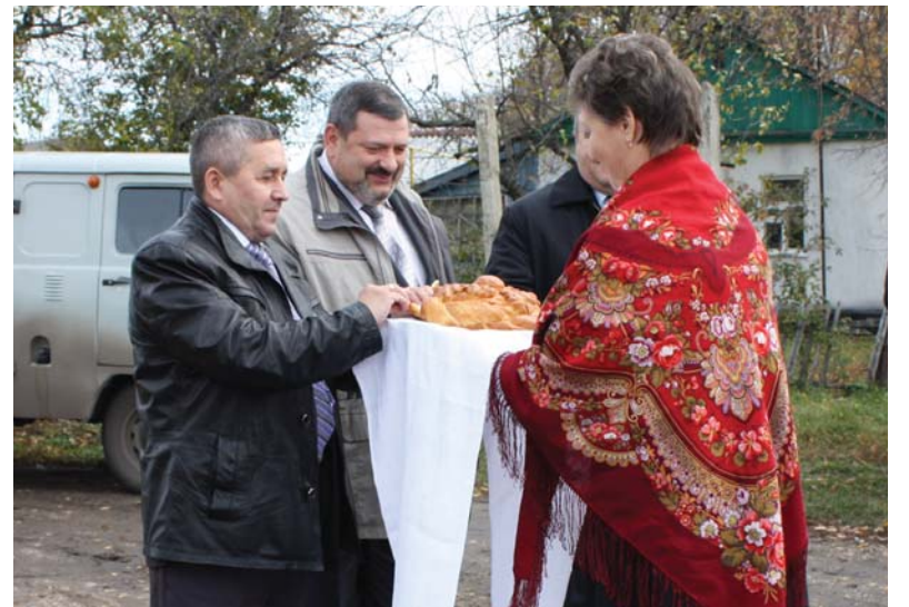
Хлеб-соль дорогим гостям

температура теперь воцарится и в сельской школе, и в фельдшерско-акушерском пункте, и в местной библиотеке.