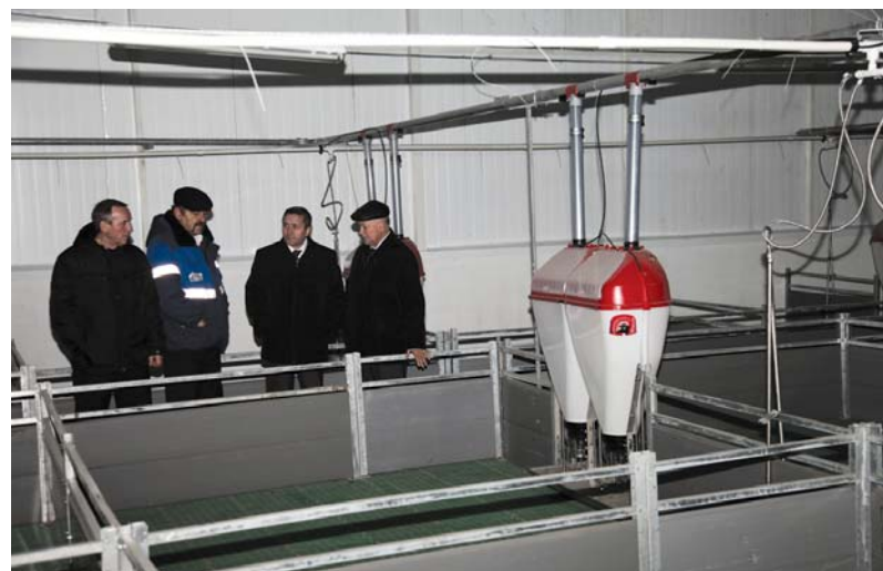
Гости осматривают помещение откормочного цеха, куда в ближайшее время планируется завезти поросят

«С появлением межпоселкового газопровода изменится