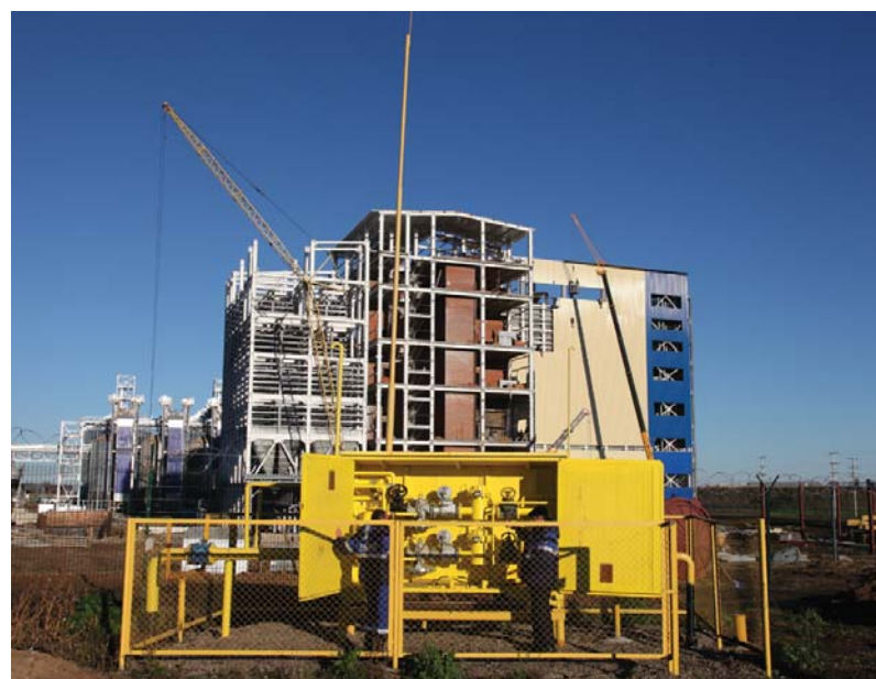
Газификация комплекса по производству комбикормов ООО «Тамбовский бекон»

«Ввод в эксплуатацию газопровода позволил обеспе-