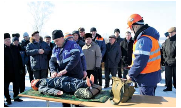
Проведение командно-штабных учений по локализации аварии при паводке в Мичуринском районе