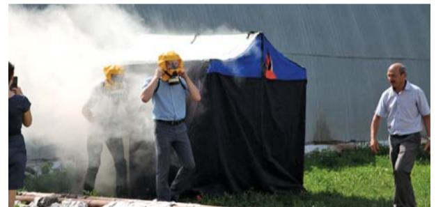
Демонстрация возможностей противопожарных самоспасателей работниками, находящимися в задымленном помещении