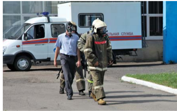
Спасение пострадавшего, заблокированного на третьем этаже, прошло успешно