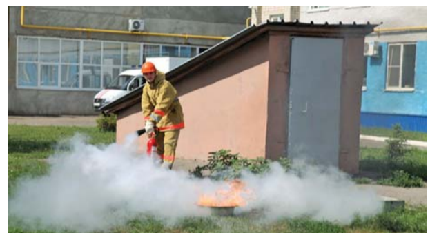
Демонстрация принципа пожаротушения с помощью порошкового огнетушителя

К другому пострадавшему – мужчине, заблокированному на третьем этаже, тут же устремляются спасатели.