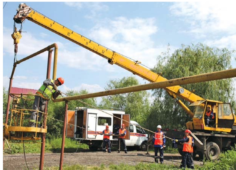
Бригада ПТУ успешно справилась с поставленной задачей, показав хорошую подготовку и наличие необходимых знаний и навыков

После занятий, в ходе проведения производственного совещания заслушали доклады руководства Общества и директоров филиалов о ходе подготовки к осенне-зимнему периоду, работе с персоналом, повышении клиентоориентированности и других важных задачах, которые стоят сегодня перед Обществом. Определены цели на ближайший период, даны поручения.