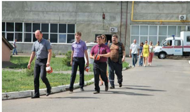
Эвакуация сотрудников из административного здания