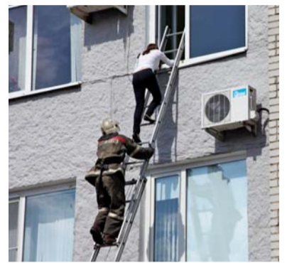
Пострадавшая сотрудница при страховке пожарного спускается на землю

В завершение учений персонал ОАО «Газпром газораспределение Тамбов» обучили пользоваться первичными средствами защиты и самоспасами. Кроме этого, наглядно продемонстрировали принцип пожаротушения с помощью гидрантов, порошковых и углекислотных огнетушителей.