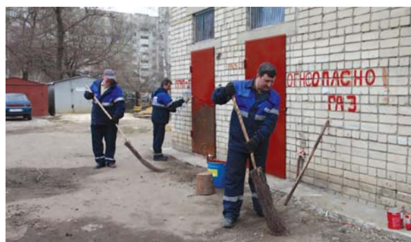
Сотрудники ОАО «Газпром газораспределение Тамбов» приводят в порядок газовый распределительный пункт по улице Пролетарской

Работники ОАО «Газпром газораспределение Тамбов», приняли участие в масштабной операции по наведению чистоты и порядка «Мой чистый город», которая стартовала с 1 апреля в Тамбове и Тамбовской области