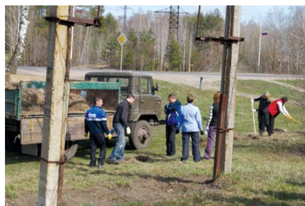
Сотрудники филиала ОАО «Газпром газораспределение Тамбов» в г. Рассказово на субботнике по уборке подведомственных территорий от мусора и сухой травы