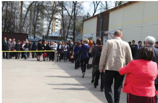
Услышав сигнал пожарной тревоги, сотрудники, согласно схеме эвакуации, идут во внутренний двор за временно оборудованный периметр ограждения