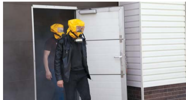
Демонстрация возможностей противопожарных самоспасателей (газодымозащитный комплект ГДЗК-А) работниками, находящимися в задымленном помещении