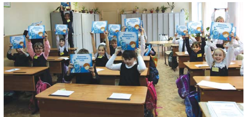
Учащиеся 3-го класса «К» МАОУ СОШ № 13 г. Тамбова

В период с 25 ноября по 25 декабря 2013 года ОАО «Газпром газораспределение Тамбов» на всей территории Тамбовской области будет проводить месячник по пропаганде безопасного пользования газом в быту. В организационный план вошли следующие обязательные мероприятия: направление информационных писем на имя глав городов и районов, руководителей предприятий об обеспечении соблюдения правил безопасности систем газораспределения и газопотребления на своих участках; распространение памяток среди населения «О правилах пользования газом в быту»; внеплановый контрольно-тренировочный вызов по локализации и ликвидации возможных аварий на газопроводе; организация открытых уроков среди школьников «Секреты природного газа», конкурсов рисунков «Что значит газ для нас» и декоративно-прикладного творчества «Служба 04» и др.