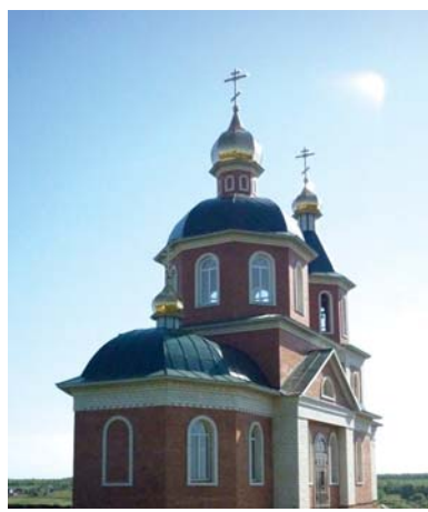
Храм в честь святителей Московских в селе Золотовка Ржаксинского района

С 1814 года в храме в честь святителей Московских села Золотовка венчали, крестили, отпевали, учили грамоте. В 1928 году службы были прекращены по решению райисполкома. Когда началась Великая Отечественная война, люди писали просьбы о восстановле-