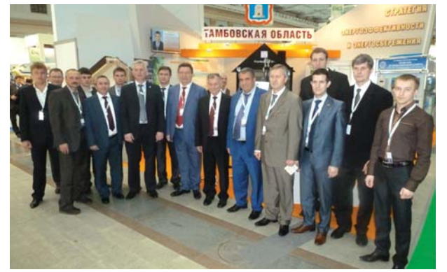
Делегация Тамбовской области

Губернатор Тамбовской области Олег Бетин, выступая на прошедшем в рамках ENES 2013 Всероссийском совещании по вопросам повышения энергоэффективности в регионах, отметил важность газификации для строительства новых объектов и, как следствие, обеспечения стабильного роста ВРП области. По словам губернатора, «в АПК региона возводятся