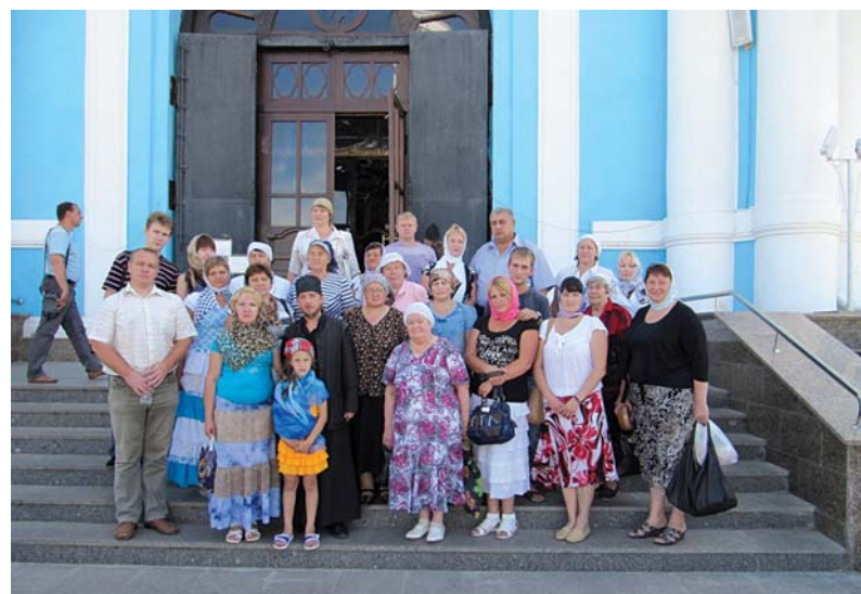
Наша группа у Владимирского собора

Перед революцией в обители находилось шесть храмов, проживало около 200 иноков. Монастырь был крупнейшим и любимейшим местом паломничества богомольцев, которые и сейчас называют его «русским Иерусалимом».