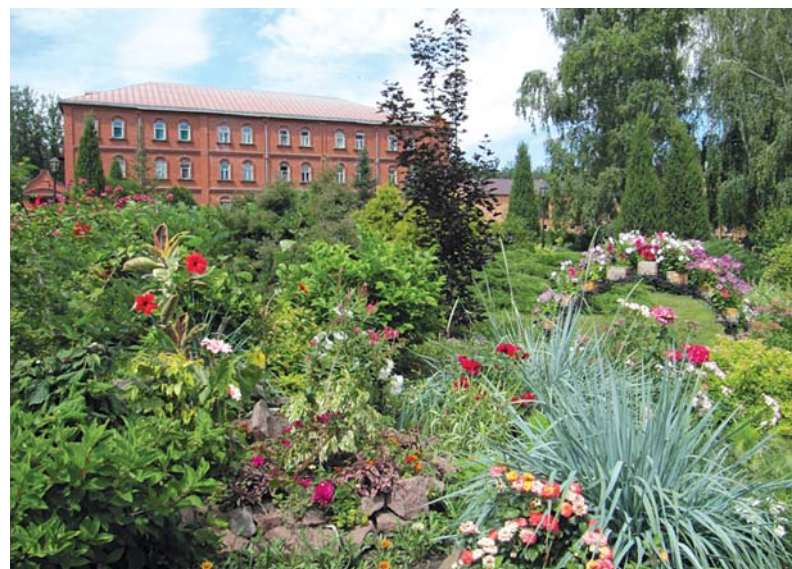
Корпус, где проживают сестры монастыря

Женская обитель построена на развалинах мужского монастыря. За эти годы руины бывшего Тихоновского монастыря вновь превратились в благоустроенную иноческую обитель. Ландшафт подворья, клумбы с цветами, контрасты цветовой гаммы создают ощущение спокойствия. В центре величаво стоит главный храм обители – Троицкий собор, построенный в русско-византийском стиле. Рядом с ним находится стройная надворная колокольня с Преображенской церковью. В память о пребывании в скиту святителя Тихона устроена особая келья. Недалеко от монастыря находится купальня над источником святителя Тихона.