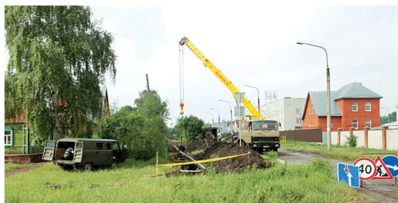
Специалисты строительного участка г. Тамбова прокладывают стальной газопровод высокого давления диаметром 219 мм от улицы Энгельса до Астраханской. Ввод в эксплуатацию данного газопровода обеспечит бесперебойное снабжение газом большего количества потребителей юго-западной части города