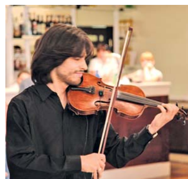
Звучат музыкальные поздравления для юбиляров

Звучат поздравления и слова благодарности и от глав города и районов. Все, выступающие подчеркивают огромную значимость деятельности газовиков, приносящих в дома людей комфорт, слаженность