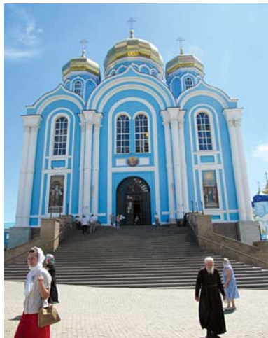
Собор в честь Владимирской иконы Божией Матери в Рождество-Богородицком мужском монастыре

В 1988 году было решено восстановить и реставрировать, как памятник архитектуры XIX века, главный собор в честь Владимирской иконы Божией Матери, построенный в русско-византийском стиле по проекту известного архитектора К. Тонна в 1845–1853 гг. Владимирский со-