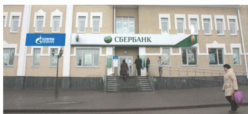
Жердевский участок ООО «Газпром межрегионгаз Тамбов» перешел по новому адресу

Современные, просторные и благоустроенные помещения позволяют газовикам обеспечить новый уровень комфорта для потребителей, а также значительно улучшить условия труда для работников Общества.