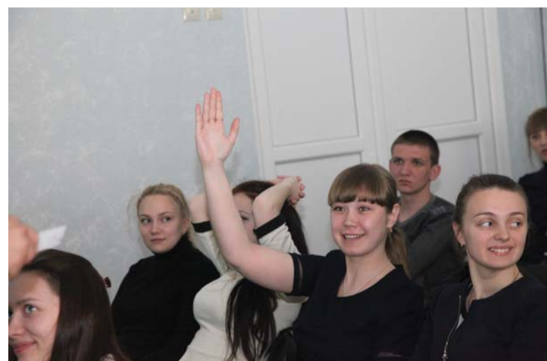
Будущие учителя сами не прочь ответить на вопросы викторины для школьников о правилах безопасного использования газа в быту

больше увеличить охват школьников, которые узнают о правилах газовой безопасности», — отметил