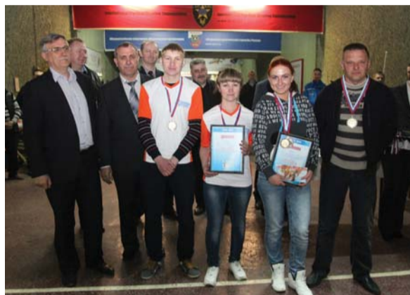
Команда филиала «Газпром газораспределение Тамбов» в г. Рассказово (2 место)