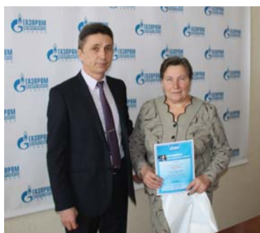
Церемония награждения победителей ежегодной акции «Оплати газ и выиграй!»

Призовые сертификаты номиналом 4 тысячи рублей дают право победителям акции в течение 2016 года пользоваться газом в пределах