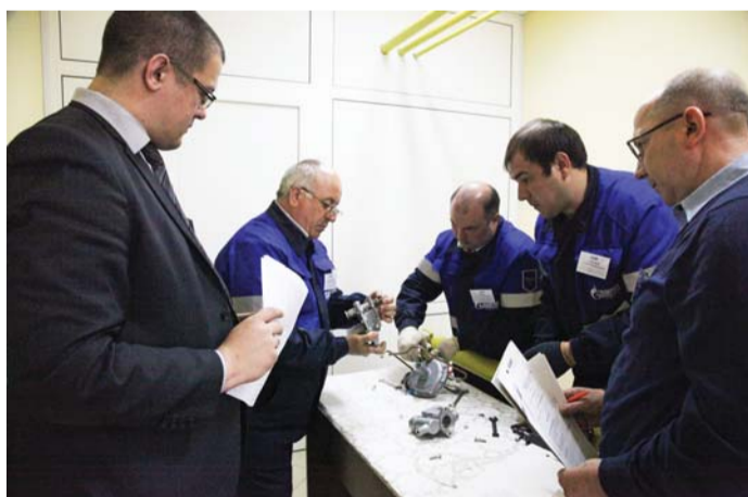
Бригада из филиала АО «Газпром газораспределение Тамбов» в п. Коммунар выполняет практическое задание

Второй этап конкурса — проверка теоретических знаний по профессии. Третий этап конкурса проходил одновременно с первым. Выполнялось практическое задание по теме: «Текущий ремонт пункта газорегуляторного шкафа ГРПШ-10МС с регулятором давления РДГК-10».