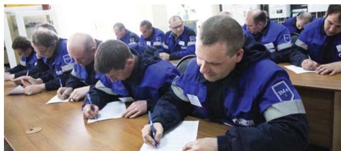
Проверка теоретических знаний