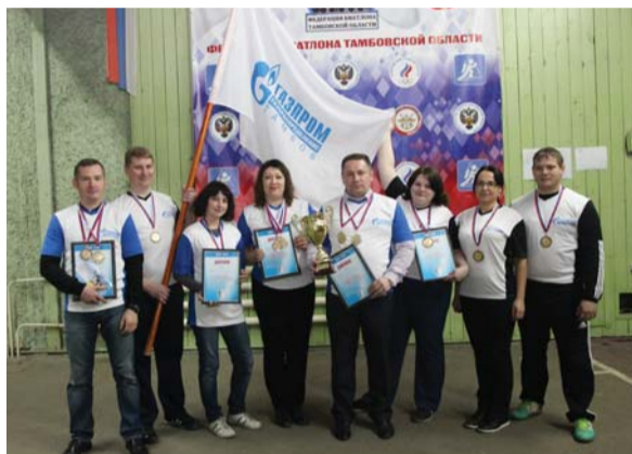
Команды центрального офиса «Газпром газораспределение Тамбов» (1 место) и филиала «Газпром газораспределение Тамбов» в г. Тамбове (3 место)