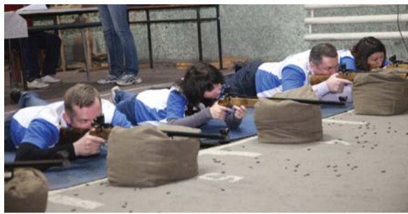
Соревнования по пулевой стрельбе. Команда центрального офиса «Газпром газораспределение Тамбов»