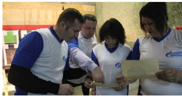
Команда центрального офиса «Газпром газораспределение Тамбов» смотрит предварительные результаты